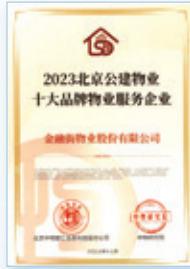
2023北京公建物業十大品牌 物業服務企業