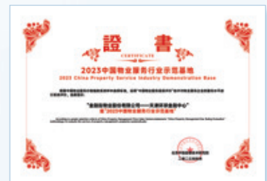
2023中國物業服務行業示範基地——天津環球金融中心