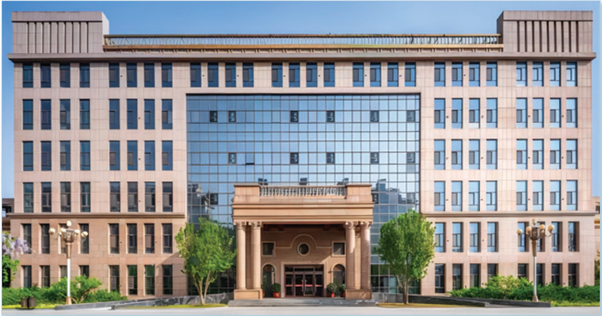
北京市大興熙誠學校

位於北京市大興區，是一所「政府支持、企業運作、教育家辦學」新型模式的在地國際化特色國有民辦學校。