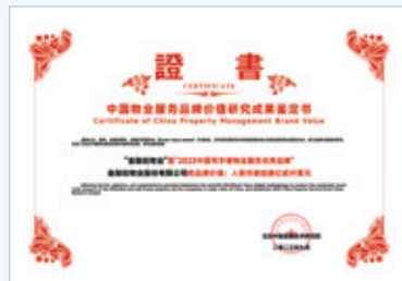
2023中國寫字樓物業服務優秀品牌