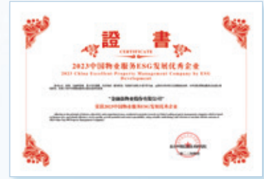
2023中國物業服務ESG發展優秀企業