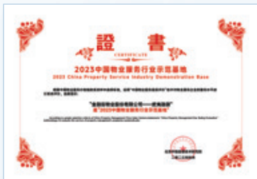
2023中國物業服務行業示範基地——武夷融御