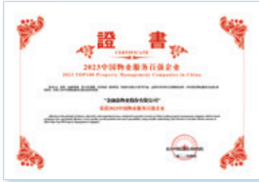
2023中國物業服務百強企業