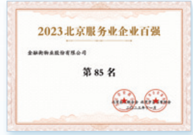
2023北京服務業企業百強