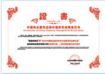
2023中國物業服務專業化運營領先 品牌企業