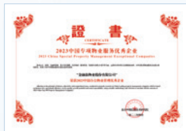
2023中國專項物業服務優秀企業——辦公物業管理