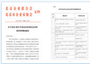
2023北京市企業社會責任優秀案例