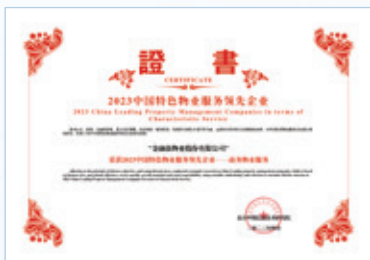
2023中國特色物業服務領先企業——商務物業服務